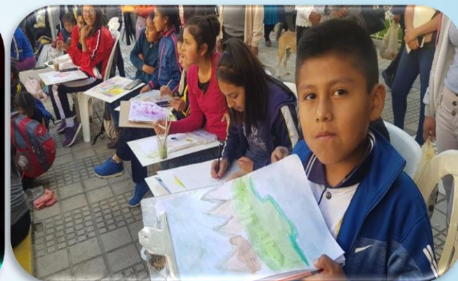
NOCHE DE TALENTOS