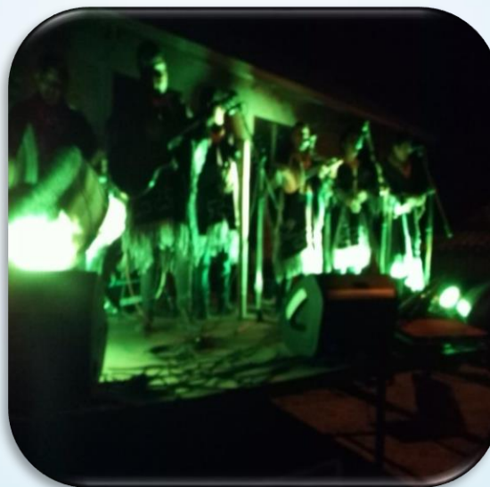
LANZAMIENTO DE LA FESTIVIDAD VIRGEN DEL AMPARO