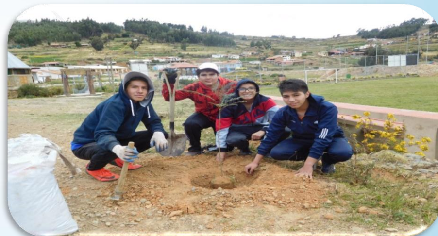
Estudiantes confraternizando la plantación y orgullosos de la labor realizada en beneficio del medio ambiente.