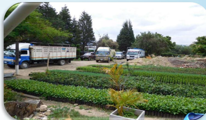
Movilidades de las comunidades de Ucuchi, Laraty y Palca esperando la entrega de los plantines.