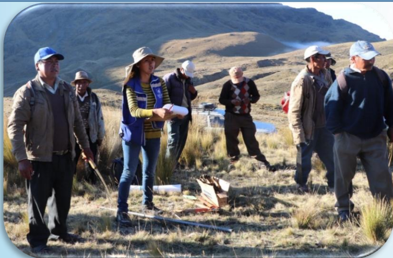
Tec. For. realizando la capacitación en manejo de plantaciones forestales con dirigentes y beneficiarios del lugar.