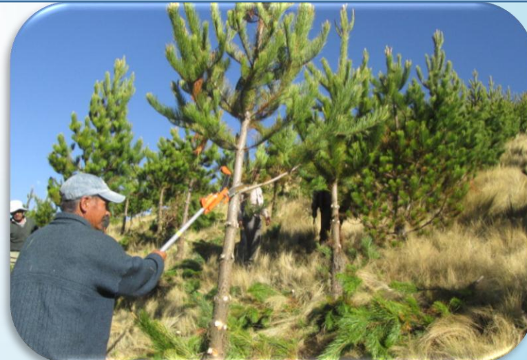
Dirigente aplicando la explicación del uso de la herramienta de podadora de altura en la Plantación comunal de Pinus radiata .