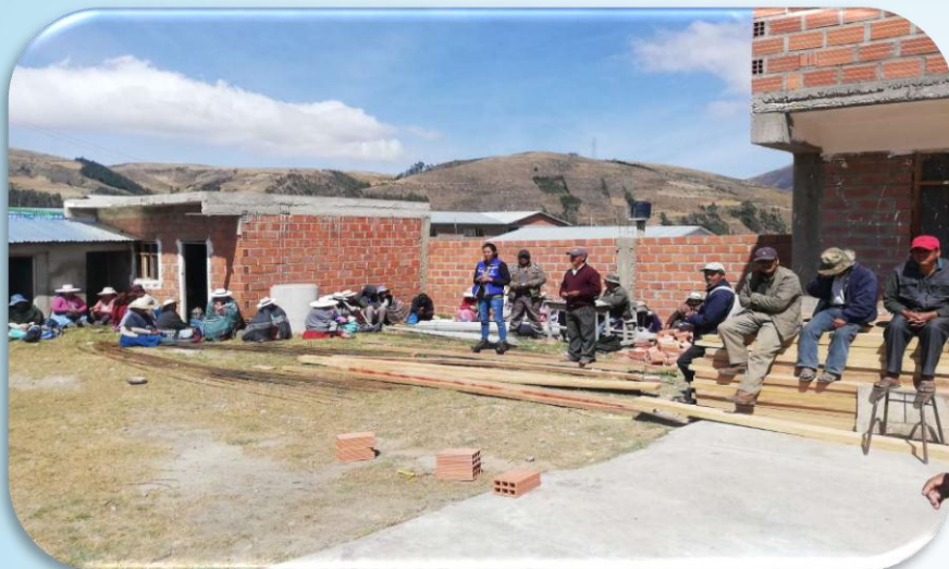
Tec. Forestal socialización los beneficios y requisitos para el Registro de Plantaciones Forestales.