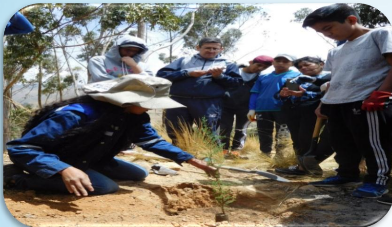
Estudiantes observando la correcta posición del plantín al momento de agregar el sustrato en la reforestación de Parque ecoturístico de San Isidro .