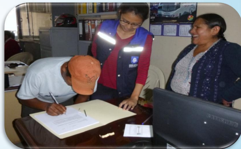
Beneficiarios y dirigente de la comunidad "Potrero" firmando el Formulario de Registro de plantaciones Forestales