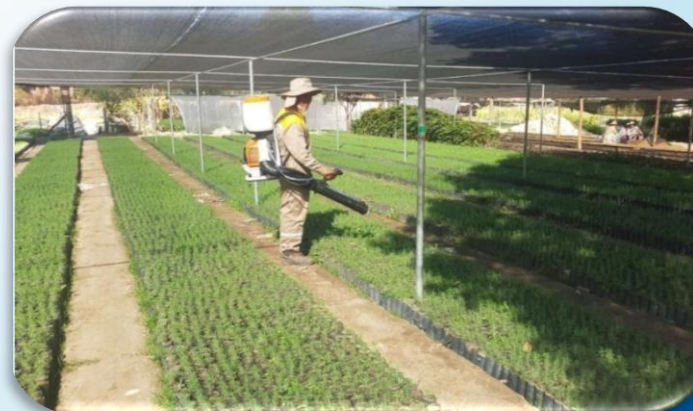
Viverista realizando fumigación foliar respectiva en plantines forestales.