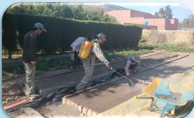
Viverista de la UFM realizando el almacigo de semillas de Pinus radiata y Eucalyptus globulus