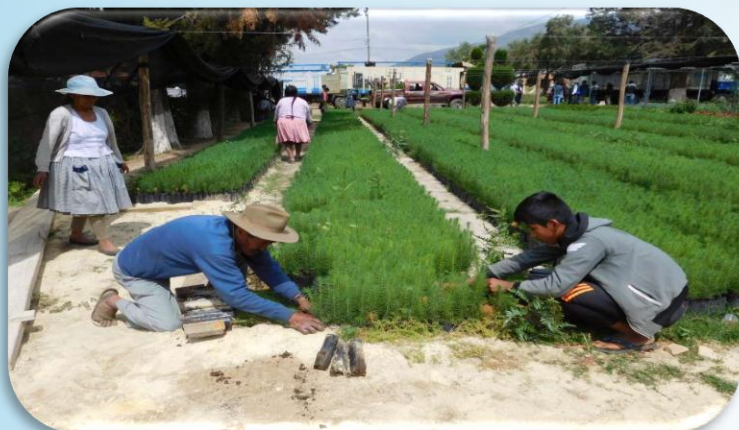
Sindicato Aguirre II recogiendo los plantines solicitados para la Plantación Forestal