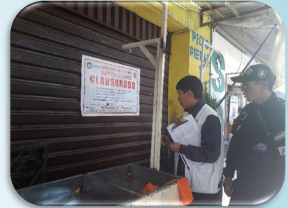
Curso de Sacaba