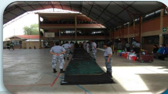
CANCHA VIAL MÓVIL INFANTIL