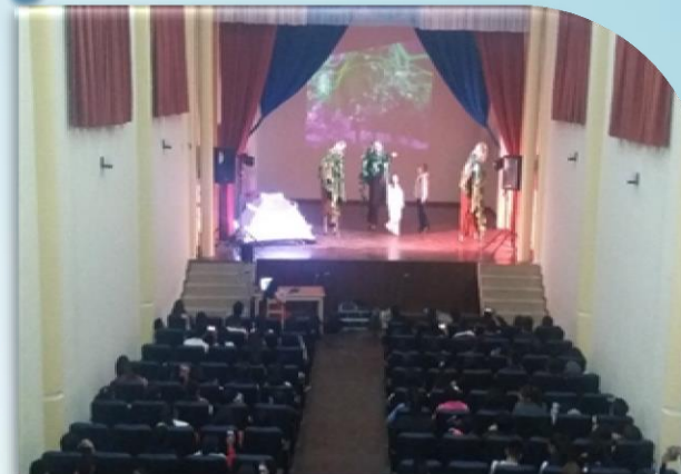
Prevención de embarazo adolescente mediante una obra de teatro "En busca del Planeta Perdido" (D - 4, 7 Lava L.)