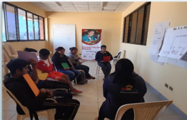
Programa "Adolescentes protagonistas del desarrollo" en coordinación con CEMSE (Centro de Multiservicios educativos)