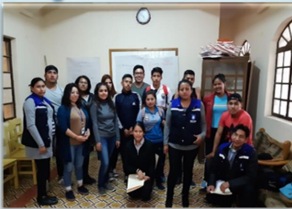
Comité impulsor de jóvenes para la Promulgación de la Ley Municipal de la juventud (D -6)