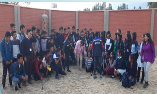
Formación a jóvenes y señoritas brigadistas en masculinidades y prevención de noviazgos violentos (D 7,4)