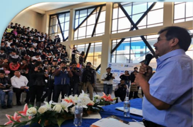
Cumbre de jóvenes para la promulgación de la Ley Municipal de la Juventud (D-6)