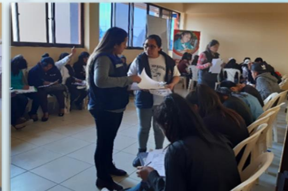
Conformación del segundo grupo para el Programa "Adolescentes Protagonistas del Desarrollo" (D - 1, 7)